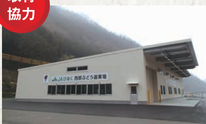
色彩選別カメラを導入したぶどう選果場

〒716-0045 岡山県高梁市中原町1383 TEL0866-22-4593 http://www.ja-bihoku.or.jp/