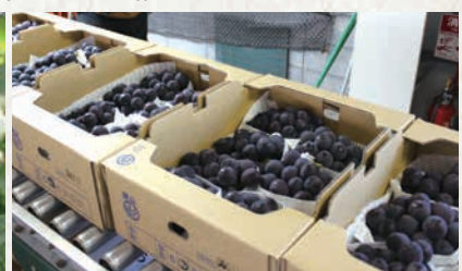
ピオーネ出荷ラインのようす