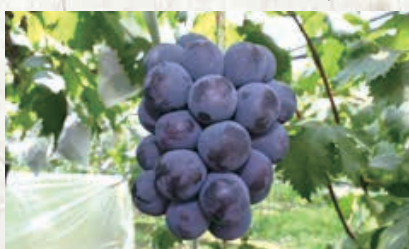
全国生産第1位岡山のピオーネ