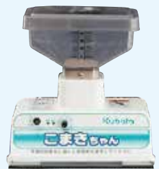
散布ボリューム目安表 (CS-30) 1kg目皿をご使用ください。