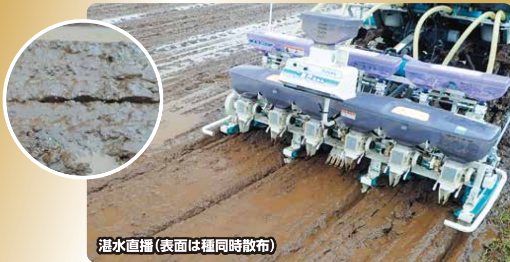
湛水直播(表面は種同時散布)