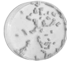
スラゴ® 浸水24時間後