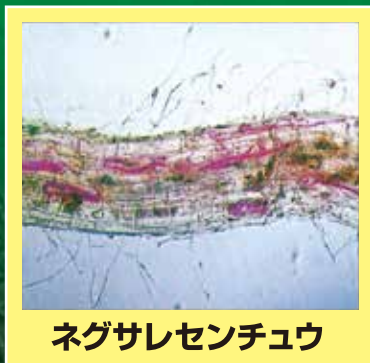
ネグサレセンチュウ