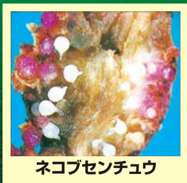
ネコブセンチュウ