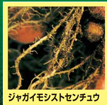
ジャガイモシストセンチュウ